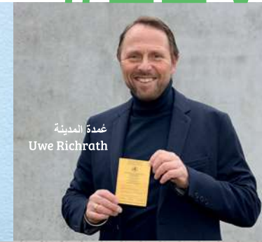
عمدة المدينة Uwe Richrath