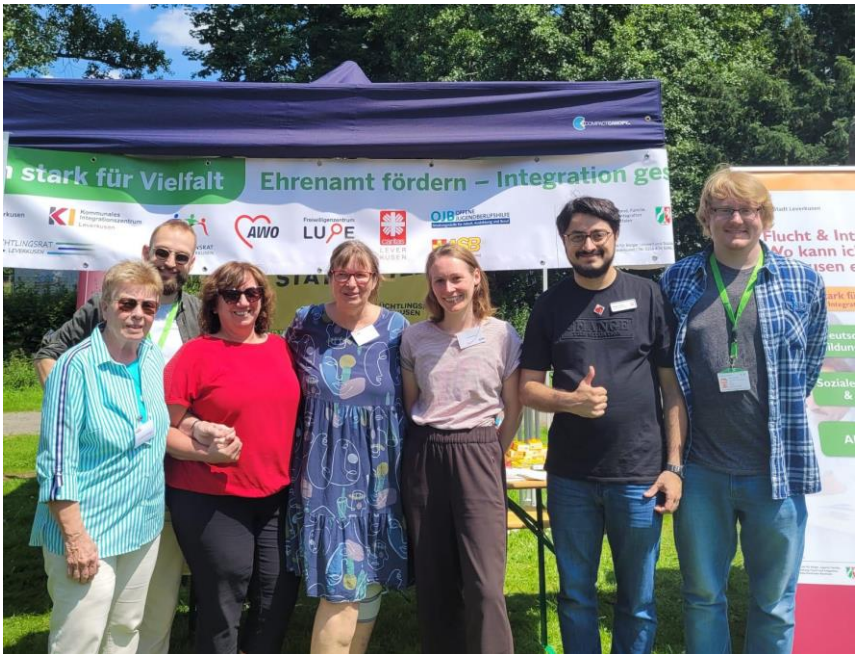
Foto: Stand der „AG Bürgerschaftliches Engagement“ auf dem Leverkusener Europafest 2023