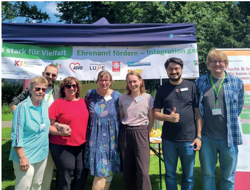
Stand der „AG Bürgerschaftliches Engagement“ auf dem Leverkusener Europafest 2023

Sonstiges: Spaß und Interesse an der Arbeit mit jungen Menschen; Regelmäßigkeit & Verbindlichkeit